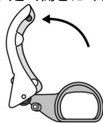
②ロック解除時 (テープセット時)