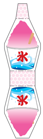
かきごおり いちご