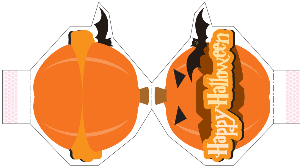
ハロウィンかぼちゃ①